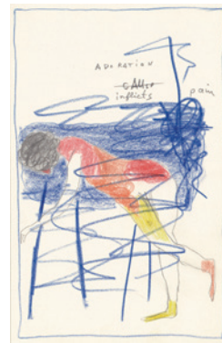
Adoration inflicts pain 憧れは痛みを与える 2018, colour pencil on paper, 21 x 14.8 cm