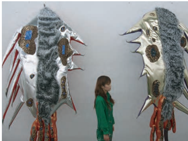
クライマックスに飛び込んだ光るイーリーが見た世界 2007, installation with video and mixed media, 200×258×103cm

1983年富山県生まれ。 2007年東京造形大学造形学部絵画科卒業。主な 展覧会に「五人展」(2003、ギャラリール・デコ、東 京) Galleryフォレスト個展(2004、東京)。現在同大 学院在籍。