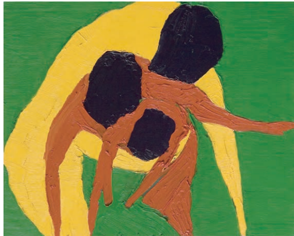
スクイ, 2007, oil on canvas, 53.0×65.2cm

1981年千葉県生まれ。 2007年東京造形大学造形学部絵画科卒業。 主な展覧会に「トーキョーワンダーウォール都 庁 2005」(2005、東京都庁第一本舎)、 「empty展」(2006、現代HEIGHTS GALLERY Den、東京)など。2007年VOCA奨励賞受賞。