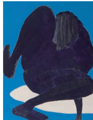
傍嶋 崇: ヒラキナオリ, 2007, oil on canvas 116.7×90.9cm

拝啓 平素は格別のご高配を賜り、厚く御礼申し上げます。このたび、ワコウ・ワークス・オブ・アートでは7月28日(土)より、厳選された若手作家による展覧会プロジェクト「from/to」を開催致します。4回目となる今展では、それぞれ異なったメディアを制作する3名の作家をご紹介します。