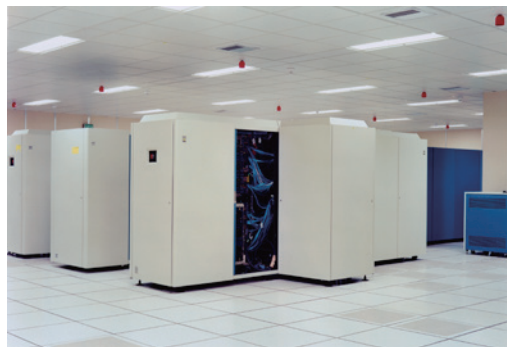
La Redoute, Lille, 1989-91, c-print, from the series 89-91 Sites of Technology