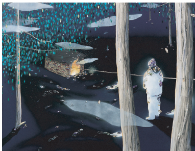
池田光弘 “Untitled” 2005, Mixed media on canvas